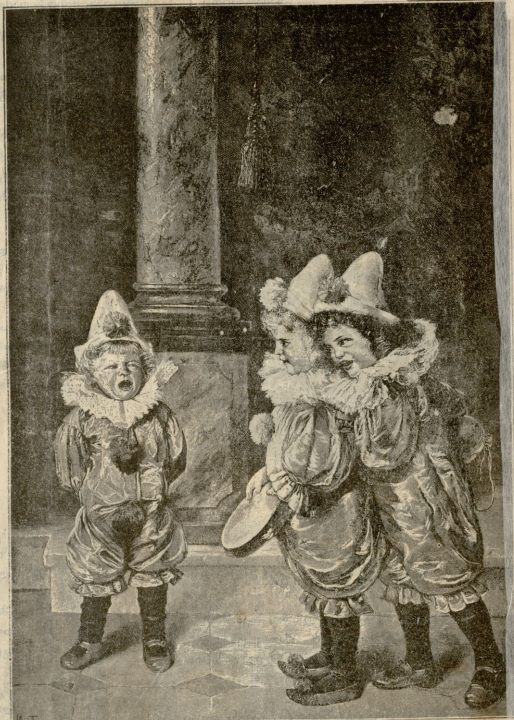
გაბაფერეს. — სურათი ლოუტისა.

— შენ ვინა, დიდებულო მბრძანებელო, საუკუნოდ იცოცხლო? — მკითხა სოლომონს მკითხავა. — არის ერთი ერთი საშუალება შენის სურვილის განხორციელებისა: მთებზე და კლდეების გულში და გამოქვაბულებში ხარბოს უკვდავების ბაღები, რომელიც კაცის თვალის უხილავად იხრდება ვინც იმ ბაღებს შეიძინეს, სიკვდილი ვერას დააკლებს და საუკუნოდ იცხოვრებს ქვეყანაზე. აი, წილედ ეს ჩემი ბეჭედიც