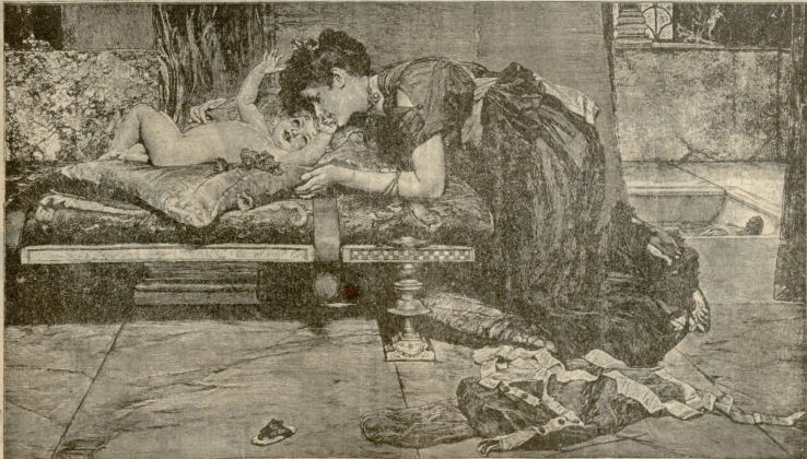
ნებაური. — სურათი აღმოკვადების

უდადესი ქაღაჭი 1950 წელს. ბავშვობა იგის, რომ დღეს მთელ დეკამანზე უდადესი ქაღაჭი ღობინი თიფება. ამე კედი პროფესორი ე. ვადადესი სწერს, ამერიკან უედადესმა გესწრო ვერბას და არ ეკა 47 წელიწადი, რომ ამ საქმეშია გუქნისის, ე. ი. უდადესი ქაღაჭი ამერიკაში იქნება. ამ პროფესორს დუედა და დუქნილებით დუთუადიერება ის ადგილები, რომელიც ნიუ-იორკს, პოსტონს და ბატონას შუა მდებარებას. სულ ეს ადგილი