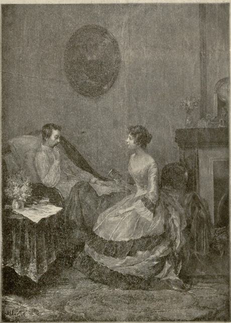
ქმარმა ჭეკანე.—სურათი ლეგენდის.

ვიგრძენი, რომ ვიღებებოდი, ვიგრძენი, რომ ვამიციებელი კაცი იმ წამზევე მოკლავდა. ერეკ ასწია მაილა ფეხი და ფეხსაცმელის ქუსლმა ვამილევთ თვალწინ. მაგრამ ამ დროს ვიღამაც უტებ სტაცა ხელი ერეგს და ისე მკრდათ დასცა მიწაზე, რომ ვერ ვავიციე, რა ნიარად მოხდა ეს. ვისარგებ-