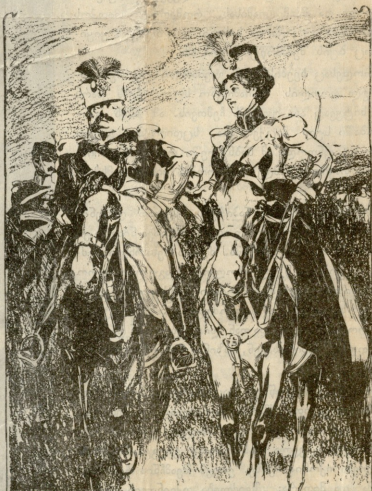
ჩემისთანა მოსიყვარბულინი რომ გეყანდეს გერბილაში, დაღატ არ უნდა ელოდბე.