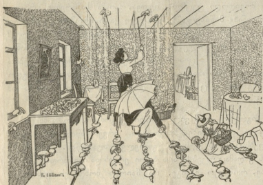
ჩვენა ავარბეკია. წვიმან დღებში სიკოის სვარბება შორს წასვლა აღარ სწირბებათ.