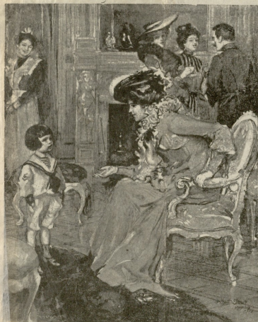
დედა. ენთ, როგორ არა გრცხენიან, კიდეც მგლი ნაშანი შიკილია სეილაში, სომ გეიყვარბება დღეს!..