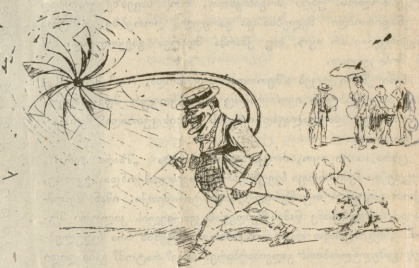
გასკრიდბული მანქანა ტფილისიუღასისთვის.