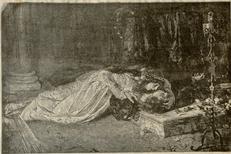
რომეო და ჯულიეტა. — სურათი ზალმაროვის.

— ეჰ, რა გეწყობა! — სთქვა ნათლიმამ და ყოყმანის შესახებ დაუმატა: — წამო, მას თითო წინწანაქარი*) მიიტე დაფლიოთ, კარგია, მუხლში ყიროთს მოგვცემს.