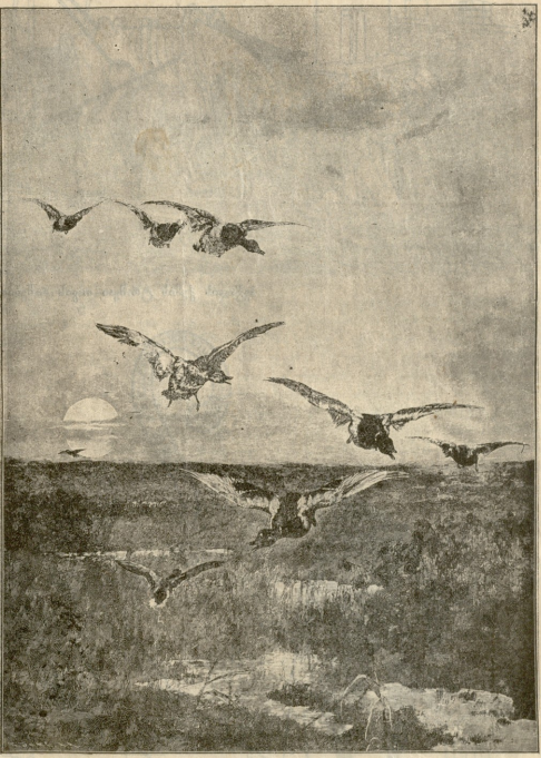
კარგული იხვება—სურ. ვასტაკისა.

ორასის წლის ვაქუთა. ეხლასან ვახუთმა ვინერ ცრუტუნგმა ორასის წლის თუბაღვი იღვესსწავლა. ორასი წელიწადი ვახუთისთვის მეტად ეტყად მინძადა. ამ ხნის განმავლობაში ვახუთმა