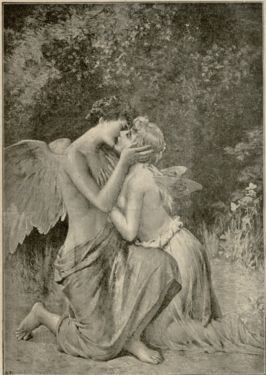
ეროტა და პსიქეა.—სურათი შუმინის.

2 მხეთი და 60 კაპ. ღირს ეთველ-ღღიური გაზეთი ცნობის ფურცელი კვირაში ორის სურათების დამატებით, 1 სექტემბრიდან წლის დამდეგამდე.