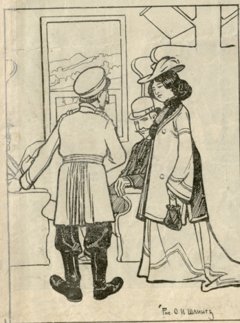
რე. ი. ი. შანიძე