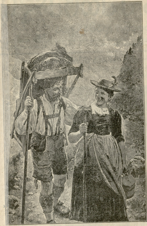
სასაამოგანო მუსსაფა.—სურათი რუსი.