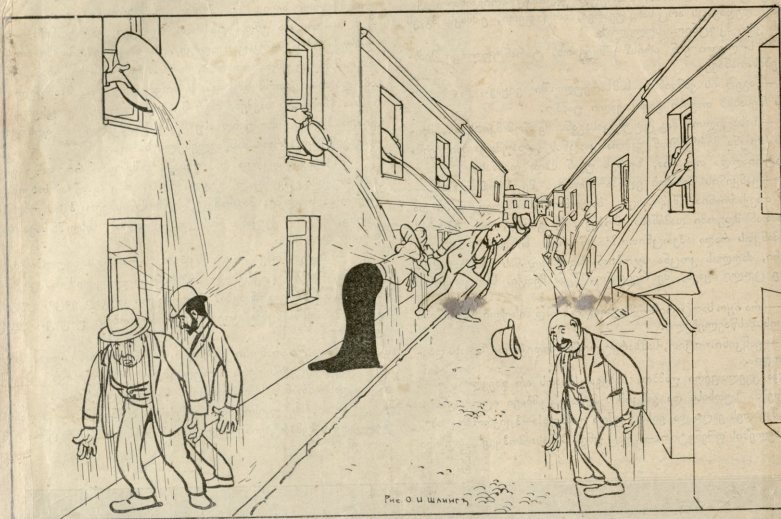
რე. ი. ი. შანიძე