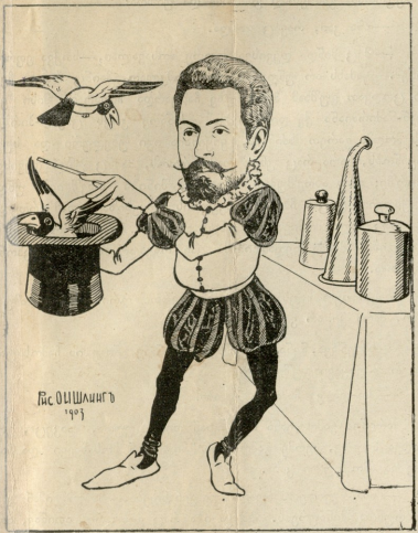
თელთმეტი ფაუნტი ხმის თელთმეტირად ხმარობს.