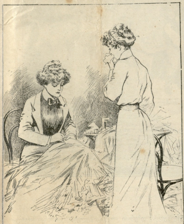
— რად ღუფურე იმის სიტუებს „შეირთავო“, კანა არ იტოლა რეგორი შატურას არან კტებო? — შარტო სიტუებს როდი ღუფურე: სპო თეე ჩემთან ცნო-რობდა და ამით შარწუნებდა შეეირთავო.