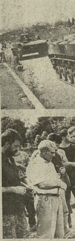
სადაც ახლახან ეკავებოდათ ქუჩები...

სადაც ახლახან ეკავებოდათ ქუჩები... აღწერის ტერიტორიის პროექტი. აღწერის ტერიტორიის პროექტი. აღწერის ტერიტორიის პროექტი.