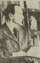
საგარეო და პოლიტიკური მიზნით

საგარეო და პოლიტიკური მიზნით. საგარეო და პოლიტიკური მიზნით. საგარეო და პოლიტიკური მიზნით.