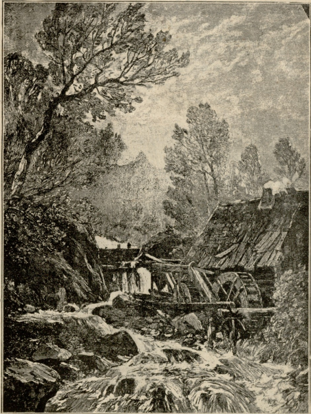
სიაფის წაქედა. — სურათი ფონ-კანახისა

მაგიერ — მტრობა. ამას არ ვგლოდი შენ, როცა კლდე-ღრმულ მიფოვავდი ვარსკვლავებისაკენ, როცა ჩემს ვარშემო სკვი- კოდნენ უფსკრულში ჩემი ამხანაგები. ვფიქრობდა: ერთი ჩვე- ვანი მაინც მიალწეებს მიზანს და მოიტანს ქვეყნად ვარსკვლავს, და იმის ბრწყინვალეობის დროს დადგება ქვეყნად ნათელი, ბრწყინვალე ცხოვრება. მაგრამ როცა დავდექე მოედანზედ, რო- ცა ცოტა ვარსკვლავის სინათლეზედ დაინახე თქვენი ცხოვ- რება, ვიგრძენ, რომ უფუნური იყო ჩემი ოცნება, ვავიგე, რომ სინათლე გესპირობათ მხოლოდ მიუწოდებლ ცაში, რომ თავყნას სკცმდეთ იმას ცხოვრების მხიარულ წუთების დროს. ქვეყნად კი თქვენთვის ყველაზედ ძაბარფასი სინთლეა, რომლის დროსაც შეგიძლიათ დემბლით ერთმანეთის და კმა- ყოფილი იყვიეთ თქვენის შავის ბნელისა და დაობებულ-და- ხავსებულის ცხოვრებისა. მაგრამ ეშაა უფრო ძლიერ, ვიდრე უწინ, ვიგრძენ, რომ აწნაირი ცხოვრება არ შეიძლება, რომ ცხოვრება თავის სინთლებრივ ტალახის ყოველის წვეთით, ნესტიან იბის ყოველის ლაშით შევკრავდეს ცას... თუცა შენიშლიან ნუფემოცა გცეთ: ბევრი ხანი აღარ ანათებს ეს ვარსკვლავი ქვე ყნას: იქ, შორეულ ცაზედ, ჰკილია ვარსკვლავი და ანათებენ თავის თავად; ხოლო კოდან მოწყვეტილი და დგდა-მიწაზედ ჩამო- ტანილი ვარსკვლავი ანათებს მხოლოდ მაშინ, როდესაც სახრ- ობს ხელში-შეჭრის სისხლით. ვგრძნობ, რომ ჩემი სიკოცხლე, რაგორც ასანთში, მაღლა მიღის სხეულიდან ვარსკვლავში და იწვის იქ. ცოტა კიდევ და ჩემი სიკოცხლე დაიწვის მთლად. არც ვაძლევს შეიძლება: იგი ჰქრება მომტანის სიკოცხლეს- თან ერთად, და ყველამ უნდა ახლად შეიძინოს იგი. მოგპარ-