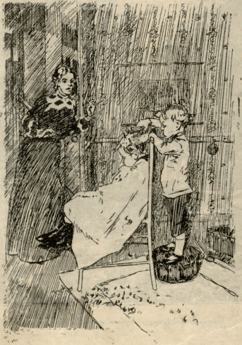
დედა. დმერთო ჩემო, რას სჩადი! შეაღა. დალაქობას ვომამობთ.