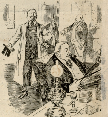
— როგორ, კუნთებს თქვენს სწრით? — ღიხ, რას იტამ, გქებებმა მარჩიეს შრამს...