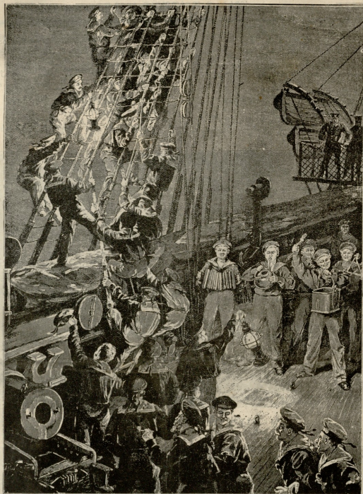
სამშობლო მოჩანს, სამშობლო! — სურათი ღმინდარისა.

— ნუ ვაგვიწორავ, შენი კირიბე ბატონო! — წარბოსთქვა მკვიტებულმა.