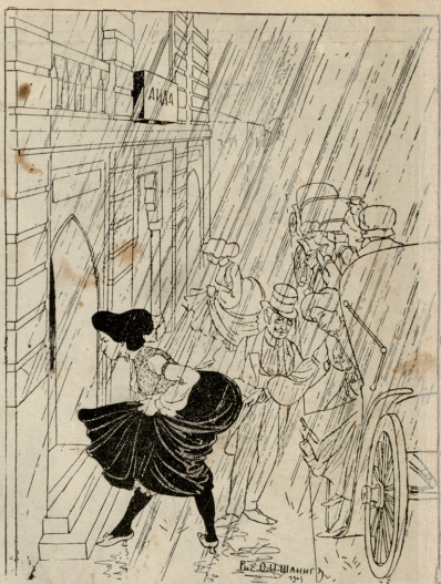
შეწეგან ტელისის თარტო მოსიარულე საზოგადოების წემა-ადარში.

სტირის საბრლო თელუ, სტირის სვე-ბელს სწეკლსო: ცოლი მოუგდა, წერილშეიღით, დარს მარტოკა ხვესო. არჩილ ს—ელა.