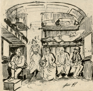
სამეხი აქურ რენის გზით მოგზაურობის.