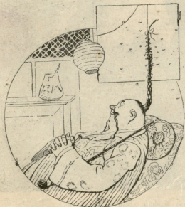
ჩანური საშუალება მამეზრებელ ბუზების მოსაშორებლად.

ჯგით დამწვარ ღედს დაუღია განიერი ქვისა და კლდის ხახა და ის გაჰკვის ასე მწარედო. ძლიერის ქარიშხალით ერთ მხარეს გადახრილ-გამხმარი, ტუის ხეებსავით დაქიული, გამბდარი, საკოდავი და მომუდარე მკლავები კედლისქვე აწეულიყნენ და იმოლენი ტანჯვასა და უომედობს გამოჰხატადნენ თავისით, რომ ქვანიც კი შემარწუნებულიყვნენ და ქაღალა, ლურჯი ღრუბენი თავზარ დაცემულნი გარბოდნენ მერყე მხარეს. მაგრამ მაღალი კედელი კი უმძრეველად იდგა და გულცივად ისმენდა ამ ღრიალს, რომელიც მურად და სქელ ჰაერს შეუზბოვრად აპობდა და მყუდროობას არღვევდა.