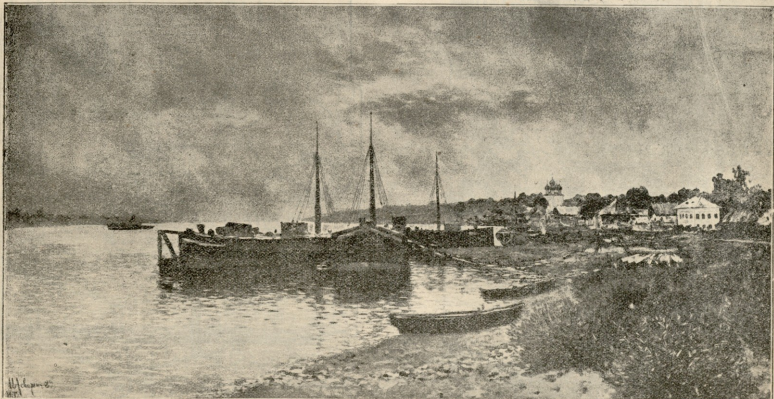
წამას შემდეგ.—სურათი ლეიტენანის.

რაფეულა დაბრუნდა ქმრის სახლში კრავივით წყნარი და მშვიდი. თან მოჰყვნენ დედა და ნათესავები.