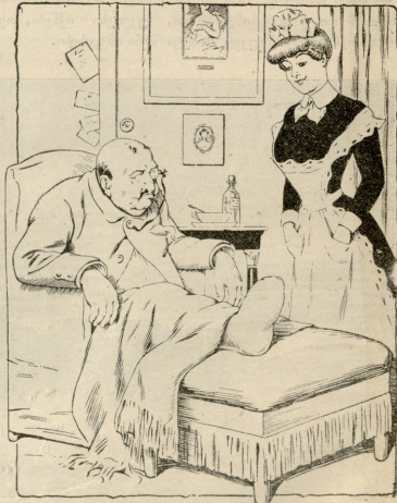
— სხვა ხომ არა გნებავთ-რა ბატონო? — ახლა! არა არავიერი.