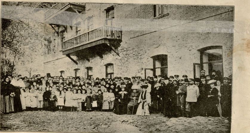
გატრა.—სემსეველი თაგშესაფარის გასნა.

გაქტერ. ვინა ესთქვი ვეა? (აფანჯანს) ვერ წარმოიღვრეთ, რა გულბაფივი ვარ. მე ორი ძმა მყავს... (გადაღმს დაფანჯა).