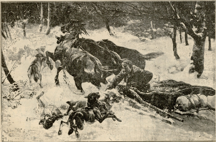
ჟენასკენდა სროდა.—სურათი ვოვალსესის.

დრო გადიოდა. ქარი ნაწყეტ-ნაწყეტადღა უბერავდა ერთს შემოქრულიანდა, შეძობივნებდა სახლს და ისევ მიწყ- დებოდა. ერთ მინან ფანჯარაში მკრთალი სინათლე შემოვი-