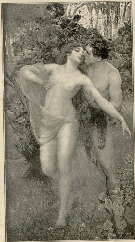
ვარგაშა. — სურათი მუღლანის.

— აღმაღ ღმერთს ვაწყენინეთ! — იტყოდა მართა, როცა ლამპარკი ჩამოვარდებოდა უამინდობაზედ, რის გამოისობით მიტკალებული ვერ დაემარბათ და ეს ექვსი დღეა სახლში ისევ-