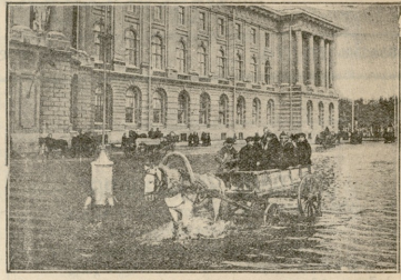
სამხატვრო აკადემიის წინ.

ძირი საქმოდ მიქრილი იყო, მაგრამ ხე ჯერ მაგრად იდგა. პავლე, ეს მხარბევიანი უპაწევილი კაცი, რომელიც ერზოდა სოფლის ტოლ-აზნაანავში, ეხლა ამ ოცდა ხუთ გოჯიან წიფლის ქვეშ მგვამო, ქონდრის კაცად სწანდა და იმისი ცული