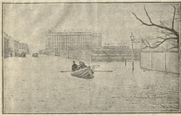
წყალდიდობა პეტერბურგში. ვასილევსკის დიდი პროსპექტი.

ამ ხმასთან ერთად ხის წვერო ირყეოდა. შეძოჭენდებოდა, გვერდზედ იწვედა თან-და-თან სისწრაჟეს უმატებდა და ბოლის საშინელის ხმაურით და ლაწი-ლუწით ეცემოდა არს.