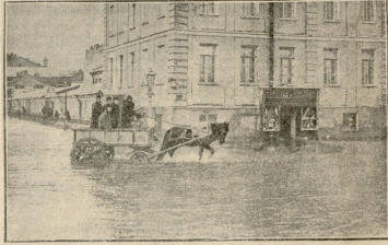
ვახილევსკის უნივერსიტეტის ქუჩა.

ქონდრის კაცის ხელში დაქერილ დანად. და ეს ქონდრის კაცი ამ ასი წლის ნაზარდ ხეს, რომლის თვითოული ტოტი პავლეზედ მსხვილია, დიდია, არ გაივლის ასი წამი, რომ ძირს დასცემს, მოუხსობს სიცილებს. პავლე ჰგრძნობს ამას, დრო გამოშვებთ ხეს აყოლებს ხოლმე წვერომდინ თვალს და თვალგებში სიამაყე ეტყობა. ჰგრძნობს თავის ძალას, ხის უძლეურობას და დაფინებით უქრის მას ძირს. პავლეს თან შიშიცა აქვს გულში. — რაიც იცის, როცა დაიძრება ეს გოლოთი, თუ არ გაუხსლტა, თავს არ უშველა, ყოველი მისი ტოტი სულს გაუქრობს, დაჭლენავს, გასკულებს, როგორც ქაიწველის ამიტომ ფრთხილობს და სხვასაც აფრთხილებს.