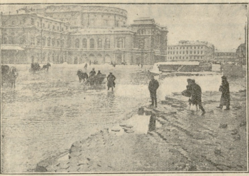
წყალდიდობა პეტერბურგში. მარინსკი თატრის შეიღანი.

იმას საითიოდ მიჰყენენ სხეებიც. ეტყობოდათ, ძალზედ ეზარებოდათ ცეცხლის მოშორება და შეშოაობის შედგომა, მაგრამ შეტი ჯანი არ იყო. არ გასულა ხუთი წამი და გაისმა ცულის პირველი კაცური.