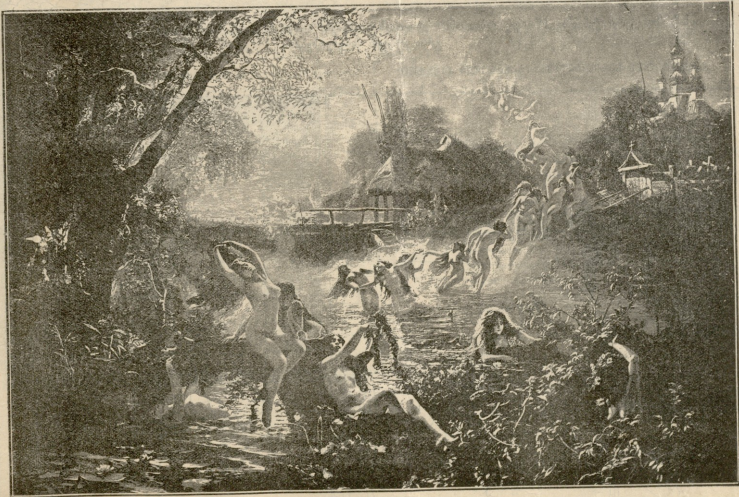
აღუბა. — სურათი მკოესის.