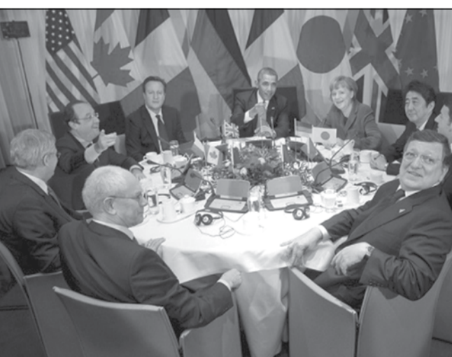
საფრანგეთის, გერმანიის, იტალიის, იაპონიის, დიდი ბრიტანეთის, აშშ-ს ლიდერები, ასევე ევროსაბჭოსა და ევროკომისიის პრეზიდენტები ღრმა შემოფოთებას გამოთქამენ აღმოსავლეთ უკრაინაში რუსეთის მხარდამჭერი სეპარატისტების ქმედების გამო.