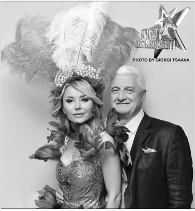
პოლიტიკიდან წავიდი, 60 წლის იუბილეს ვერ აღვნიშნე „ცენტრ პოინტთან“ დაკავშირებული პრობლემების გამო, ახლა ჩათვალეთ, რომ ამ პროექტში მონაწილეობით, ორთვიანი იუბილე გამიმართეს.

მართალია, უგულავას ნამოწიყებულმა შავმა პიარმა სახელი გაავიწყება, მაგრამ „ორი ვარსკვლავი“ გადასარევი პიარსვლა გამოდგა. ჩემთვის ყველაზე ლამაზი პერიოდი იყო, 50 წლის იუბილე ვერ გადავიხადე, რადგან სააკაშვილი შემოვარდა გიჟივით და