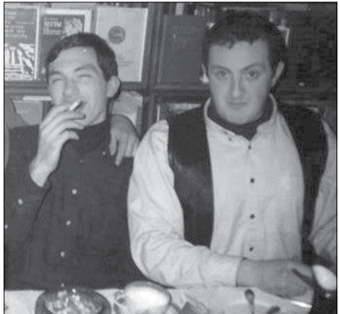
გიგა ბოკერია და გიორგი მარგველაშვილი

წინასწარი ინფორმაციით, შემოდგომისთვის ნაციონალური მოძრაობას ბევრი დატოვებს და „ქართული ოცნების“ პარტიული რიგებიც შეთხელდება. მათ შორის ისეთებიც იქნებიან, კოალიციის პოლიტიკურ სახედ რომ ითვლება. ამ კონტექსტში უკვე კარგა ხანია ერთ-ერთ მთავარ ფიგურანტად განიხილება ირაკლი ალასანიას, რომელსაც, მართალია, 2012 წლის 1 ოქტომბრის არჩევნების შემდეგ, პარტიული სტრუქტურები თითქმის აღარ შერჩა, მაგრამ, თუკი წარსულს გადავხედავთ, ყოველთვის კოალიციის წევრი სხვა პარტიების ხარჯზე პარაზიტობდა. თუკი მოვლენები ამ კულუარული ვერსიის შესაბამისად განვითარდა, ნაციონალური მოძრაობის ახალ შტოსთან კავშირი და დიდი პროდასავლური გაერთიანების ლიდერობა