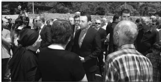
ირაკლი ღარიბაშვილია მსხეთა-მთიანეთი მოინახულა

პრემიერ-მინისტრმა სოფელ ბულაჩაურის მოსახლეობასთან საუბრისას განაცხადა, რომ ხელისუფლების ვალდებულებაა, აკეთოს საქმე და იზრუნოს ხალხზე.