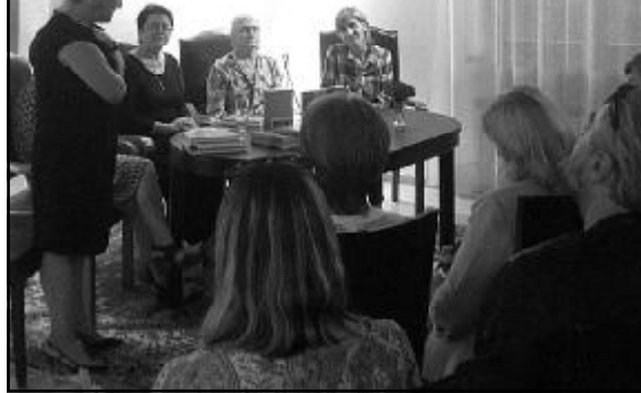
პატივსაცემი ლატივის რესპუბლიკის საელჩოში გამართული წიგნის წარდგენიდან

საინტერესოა ზოგიერთი დეტალი წიგნის ავტორის ბიოგრაფიიდანაც. იგი თავისი ნაწარმოებების გმირის – 5 წლის ლაურას მსგავსად დღენაკლული და თითქმის განწირული დაიბადა ციმბირის ბანაკში და შიმშილით სიკვდილისაგან ამავე ბანაკში მყოფმა ერთ-ერთმა ქართველმა მეძუძურმა პატიმარმა გადაარჩინა. მისი ცხოვრებიდან აღსანიშნავია საქართველოსთან დაკავშირებული კიდევ ერთი საყურადღებო დეტალი. მრავალი ლიტერატურული ჯილდოს მფლობელ პოეტს ერთ-ერთი პირველი დიდი აღიარება თბილისში სვდა წილად – 1979 წელს 27 წლის მარა ზალიტეს შემოქმედება პოეტებისათვის ერთ-ერთი გამორჩეული ჯილდოთი – ვლადიმერ მაიაკოვსკის პრემიით აღინიშნა.