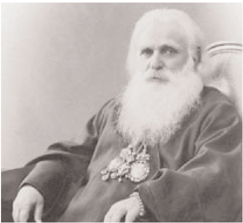
(იბეჭედა „ილოხის“ 133 ნომრიდან)

საპატრიარქოს კათოლიკოს-პატრიარქის, უფიქსისა და უნიტარქის ამბროსის ცხოვრება და მოღვაწეობა.