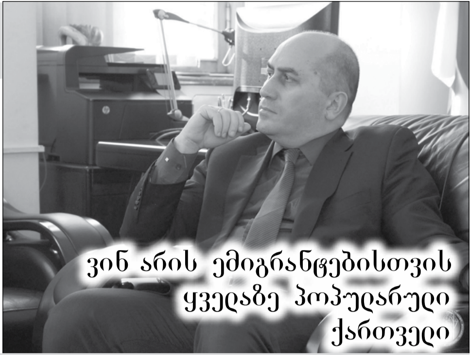
ვინ არის ემიგრანტებისთვის ყველაზე პოპულარული ქართველი

„ღეს საქართველო მზად არაა, დაბრუნებულთა დიდი მასები ღირსეულად მიიღოს“