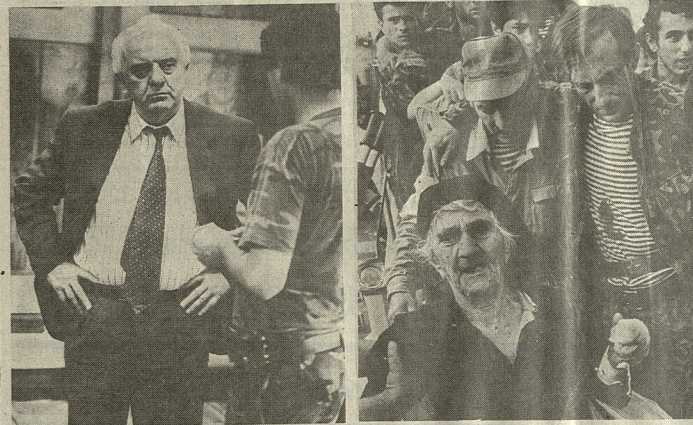
შეხვედრა აფხაზეთის რეგიონალურ ადმინისტრაციასთან