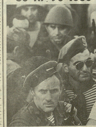
შავაძის ანკარის ფოტო. საქართველოს ზეგზებელი სხუთ კვირ.