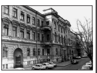
როგორ ვიწვევით, ახლანდელმა გამართა საქართველოს მოსამართლეთა IV კონფერენცია, რომლის მონაწილეებმა მრავალ აქტუალურ საკითხზე იმსჯელეს და რეფორმის შემდეგ გაწეული საქმიანობის ანგარიში მოახდინეს.

როგორ ვიწვევით, ახლანდელმა გამართა საქართველოს მოსამართლეთა IV კონფერენცია, რომლის მონაწილეებმა მრავალ აქტუალურ საკითხზე იმსჯელეს და რეფორმის შემდეგ გაწეული საქმიანობის ანგარიში მოახდინეს. მოსწონებს გააკეთა უნდა გამართა მოსამართლეთა IV კონფერენცია, რომლის მონაწილეებმა მრავალ აქტუალურ საკითხზე იმსჯელეს და რეფორმის შემდეგ გაწეული საქმიანობის ანგარიში მოახდინეს.