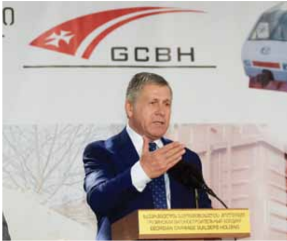
ბადრი წილოსანი - საქართველოს „ვაგონმშენებელთა ჰოლდინგის“ პრეზიდენტი

შეიძლება ითქვას, რომ მნიშვნელოვანი ნაბიჯები გადაიდგა, ქვეყანაში მძიმე მრეწველობის ამ მეტად მნიშვნელოვანი დარგის განვითარებისთვის.