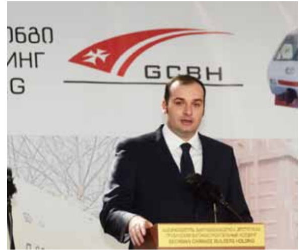
მამუკა ბახტაძე - „საქართველოს რკინიგზის“ გენერალური დირექტორი