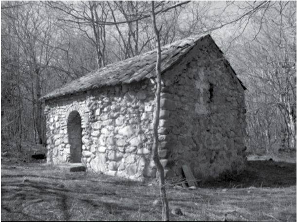
ანთოკის „წმინდა კვირიკე“