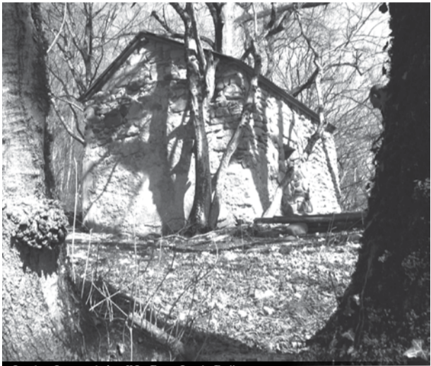
მარიამჯვარის „წმინდა მარინე“

სოფლის სახელწოდება მარგლის მეორენაირი სახელის — მანას მრავლობითი რიცხვის ფორმა უნდა იყოს. მანას ადრე მიჯნისა და საზღვრის ფუნქცია ჰქონდა და სწორედ აქედან მომდინარეობს სიტყვა „სამანი“.