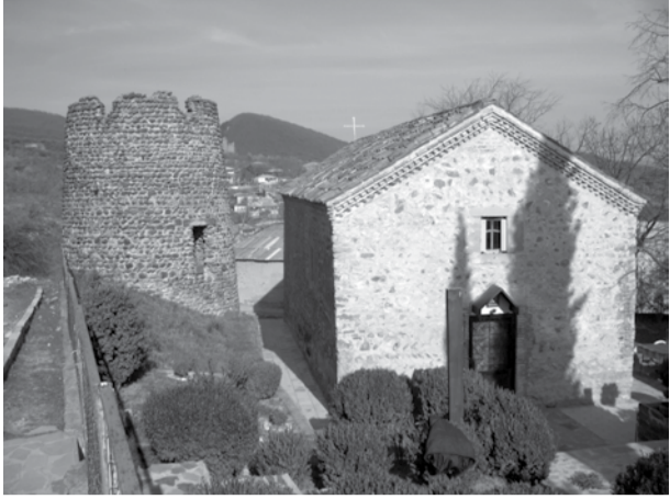
გიორგინმინდის ღვთისმშობლის კომპლექსი

თუ სამეცნიერო სასწაული არ მოხდა და ტოპონიმი „მანავი“ უძველეს ნინაზიურ გაერთიანება „მანას“ არ დაუკავშირდა, მაშინ