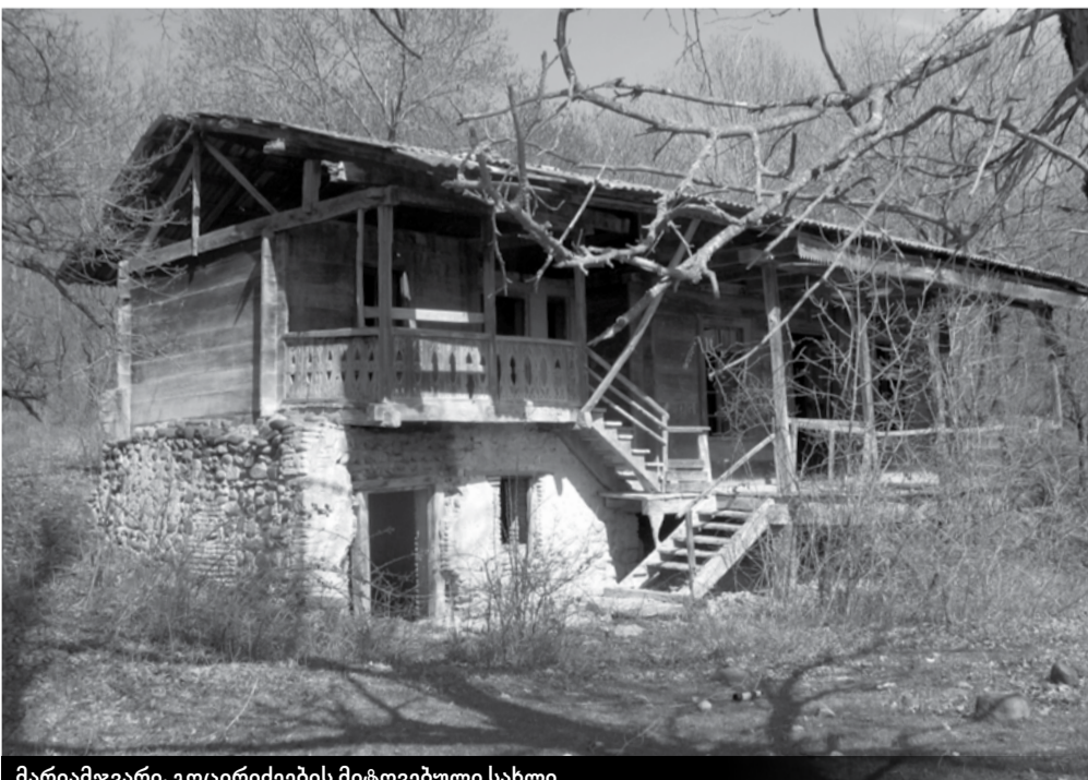
მარიამჯვარი. გოცირიძეების მიტოვებული სახლი

ეკლესია სამოყვარულო დონეზეა ალდგენილი. რის გამოც სიმაღლეში ქვათა ნყოფის რამდენიმე რეგისტრი და ლავგარდანი აკლია, გადახურვითაც, უზრალოდ თუნუქის სახურავითაა გადახურული. ადრეშუასაუკუნეების საყდარს ერთადერთი კარი სამხრეთიდან აქვს და ახლა არქიტრავულია, მაგრამ ძველი ნაშენობის კვალი ლუნეტურ ფორმაზე მიგვაჩინებს. მისგან მარჯვნივ და ზევით სწორკუთხა სარკმელია. ორი ასეთი სარკმელი ჩრდილოეთ კედელშიცაა, საკურთხეველში კი ერთი ვიწრო სარკმელია