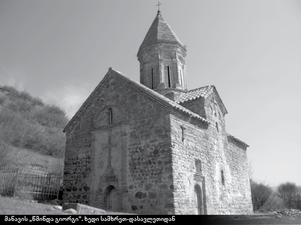
მანავის „წმინდა გიორგი“. ხედი სამხრეთ-დასავლეთიდან