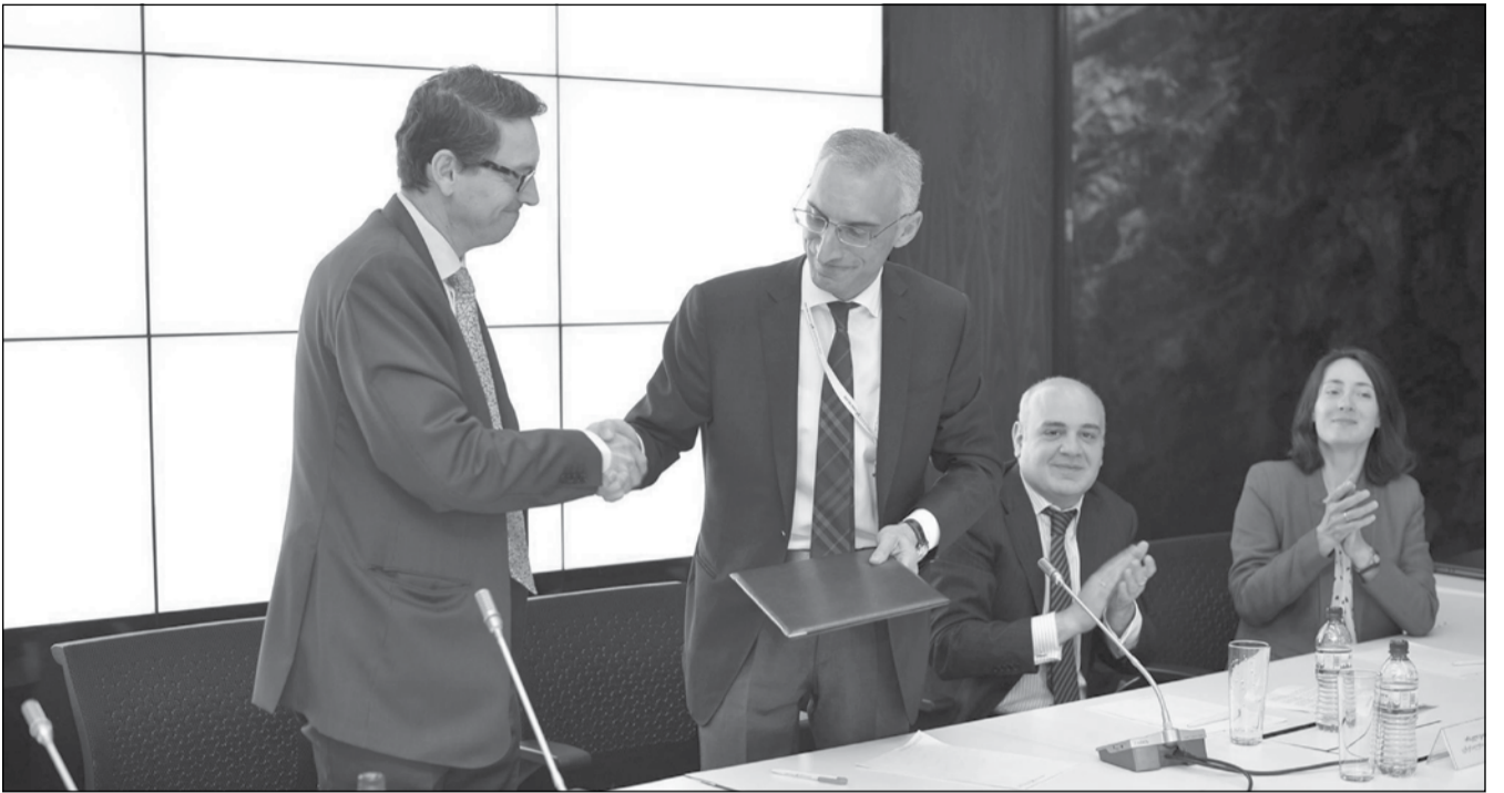
სესხი ხელს შეუწყობს „საქართველოს ბანკს“, გააფართოვოს ფინანსური მომსახურება და წახადისოს ეკონომიკური ზრდა ქვეყანაში