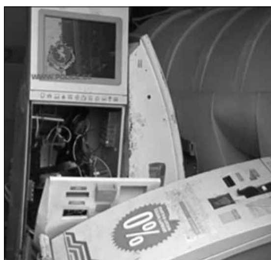
სსკ-ს 177-ე მუხლის მე-2 ნაწილის „ა“ ქვეპუნქტით და მე-3 ნაწილის „ა“ ქვეპუნქტით.

გამოძიება მიმდინარეობს წინასწარი შეთანხმებით ჯგუფის მიერ ქურდობის ფაქტზე, რამაც მნიშვნელოვანი ზიანი გამოიწვია (საქართველოს