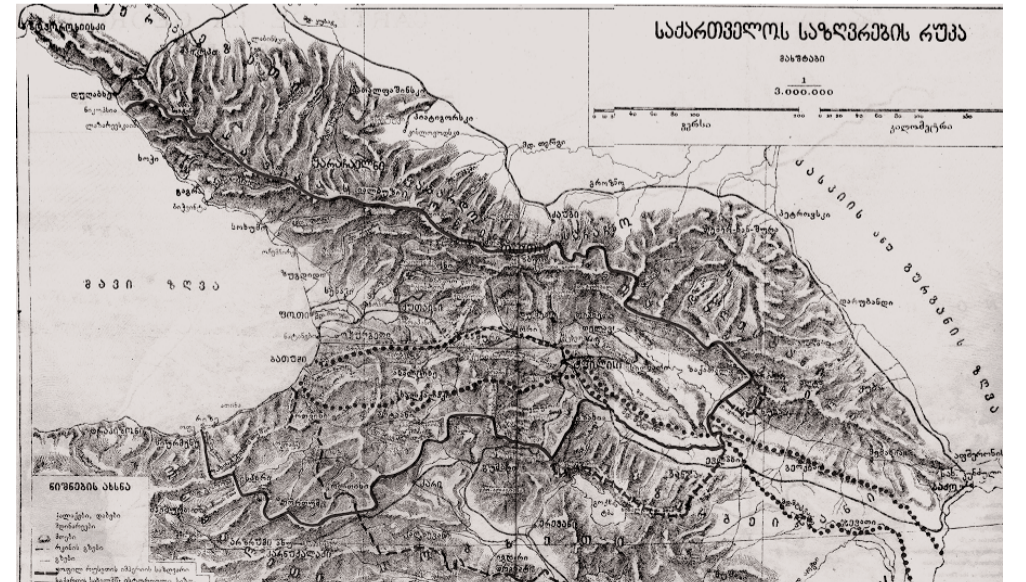
საქართველოსადმი სომხეთის ხელისუფლების ტერიტორიული პრეტენზიები 1918-1920 წწ.