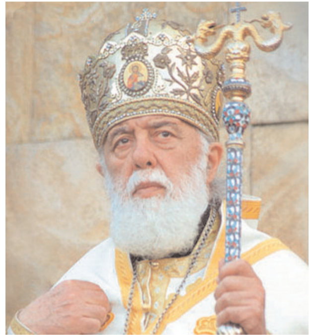
უფალმა დაბლოცოთ და ბაბაქლიეროთ!

სახალხო მოძრაობა „სამეგრელო“ და ბაზეთი „ილორი“ სრულიად საქართველოს ულოცავენ აღდგომის ბრწყინვალე დღესასწაულს!