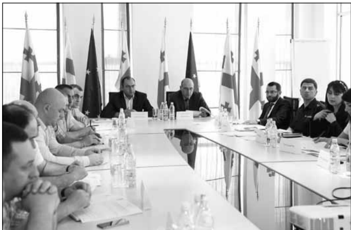
არეს. შეხვედრის შედეგად მიღებული რეკომენდაციები აისახება ოჯახში ძალადობის პრევენციისა და მასზე ეფექტიანი რეაგირების კომისიის მუშაობაში.

შინაგან საქმეთა სამინისტროს „ოჯახში ძალადობის პრევენციისა და მასზე ეფექტიანი რეაგირების კომისიის“ წევრებმა ქვემო ქართლის სამხარეო მთავარი სამმართველოს და საპატრულო პოლიციის დეპარტამენტის ქვემო ქართლის მთავარი სამმართველოს წარმომადგენლებსა და ქვემო ქართლის გუბერნატორის მოადგილეებთან ერთად სამუშაო შეხვედრა გამართეს.