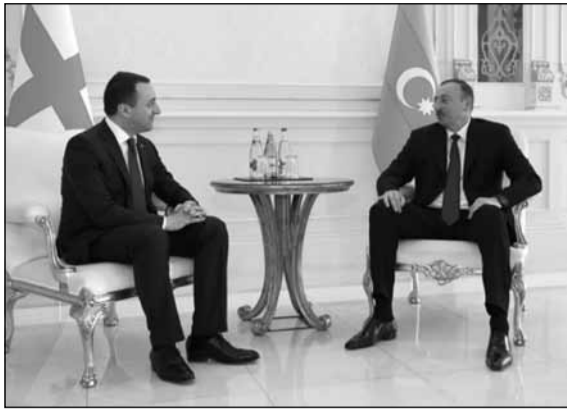
და კონსტრუქციული თანამშრომლობა აკავშირებს.