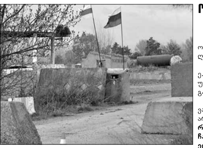
აღსაშენებელი ცხინვალის რეგიონის ე.წ. კაგებეს თანამშრომელი ე.წ. საზღვრებზე მოქალაქეების გადაადგილება ჩვეულ რეჟიმში 9 აგვისტოდან აღდგება.