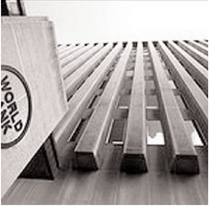
ცნობილია, რომ მსოფლიო ბანკის მონაცემებით, 2009 წლისათვის ემიგრაციაში საქართველოდან 1 058 300 ადამიანი იმყოფება. ეს ქვეყნის

მოსახლეობის 25,1 პროცენტია. 2010 წლის მდგომარეობით, საქართველოდან ემიგრანტთა რაოდენობით პირველ ათეულში შედიან: რუსეთი, სომხეთი, უკრაინა, საბერძნეთი, ისრაელი, აშშ, გერმანია, კვიპროსი, ესპანეთი და თურქეთი. აღნიშნულ 10 ქვეყანაზე ემიგრანტთა მთლიანი რაოდენობის 88 პროცენტი მოდის, მათ შორის კი უკონკურსოდ უკავია პირველი ადგილი რუსეთს, რომელიც საქართველოს არაქართულ ხელისუფლებას ქართველი ხალხის დაუძინებელ მტრად ჰყავს შერაცხული. ემიგრაციის მთავარი მიზეზი რომ თავის სარჩენი საშუალებების გამოხსენა, ამას დღეს „ნაციონალების“ გარდა არაფერ დაობს, რადგან სწორედ ისინი ამტკიცებენ დაქვემდებარებულ საქართველოსზე,