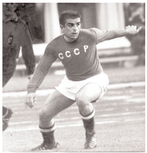
მურთაზ ხურცილავა, მურთაზ ხურცილავა, მურთაზ ხურცილავა

სპორტსმენში მოიყაროს თავი, მურთაზი კი სწორედ ამგვარი გამოჩენის გახლდათ! წლები გავიდა, ქართულ ფეხბურთშიც თაობები ენაცვლებოდნენ ერთმანეთს და იგი დღემდე მოგვივიდა საამაყო სახეებით დამშვენებული. თუნდაც კახი კალაძე რად ღირს, რომელიც, მიუხედავად მავანთა ავი ფარყაშისა, ყოველთვის დარჩება არა მხოლოდ სპორტის, არამედ სრულიად საქართველოს სიამაყედ!