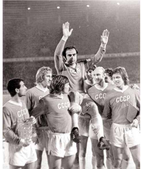
მილიონობით გულშემატკივართან ერთად მურთაზ ხურცილავა

2004 წელს შუშუმ ადნიშნა მისი დაარსების 50 წლის იუბილე. ამასთან დაკავშირებით, ევროპის ყველა ქვეყანაში, სპეციალური გამოკითხვით გამოვლინდა ამ პერიოდის (1954-2004 წ.წ.) ქვეყნის საუკეთესო ფეხბურთელი. საქართველოში ასეთ ფეხბურთელად მურთაზ ხურცილავა აღიარეს. ამ შედეგიდან გამომდინარე, მურთაზ ხურცილავა დაჯილდოვდა სპეციალური მედლით, მისი ფოტოსურათი კი გამოფენილია შუშუმ-ს შტაბ-ბინაში, სხვა ქვეყნების საუკეთესო ფეხბურთელთა ფოტოებთან ერთად.