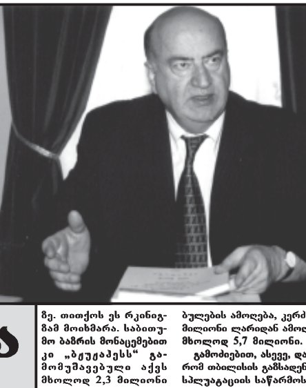
ენერჯეტიკის განვითარების პრობლემა საქართველოში...