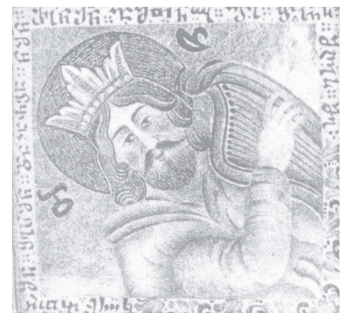
შოთა მგოსანი მანდატურთუხუცესი. 1184-1198