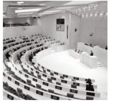
პარლამენტის შენობის მშენებლობის პროექტის დოკუმენტაცია, რის გამოც ვერ მოხერხდა ფაქტობრივად გაწეული ხარჯების პროექტით გათვალისწინებულ ხარჯებთან შედარება.