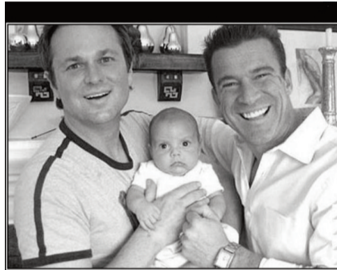
ლეღაჩეი სღ არის თქვე პიღარასტაბო?