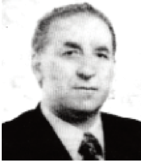
დასაწყისი "ილორი" №171-226

“ამგვარად, დავით აღმაშენებლის მიზანი ნათელი იყო: გადაეჭვინა გელათი მაღალი დონის კულტურულ-საგანმანათლებლო და სასწავლო-სამეცნიერო ცენტრად. გელათის აკადემია დაარსებული უნდა იყოს 1106-1110 წლებში, ე. ი. დვითისმშობლის სახელობის ტაძრის მშენებლობის გასრულებამდე” (როინ მეტრეველი, გელათი-მეორე იერუსალიმი და ახალი ათენა, გ.ა. „საქართველოს რესპუბლიკა“, 2006, 20 ივლისი, №139, გაგრძელებები იმავე გაზეთის 21 და 22 ივლისში №140 და 141-ში).