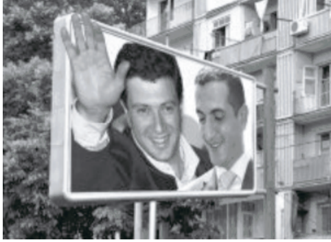
რატომ დღეს ახალი ხელისუფლება?!

იმას, რაშიც დღეს "აუთდორ.ჯი" მერიას 6 ლარს უხდის, თავად 30-40 დოლარად აქირავენ(!)