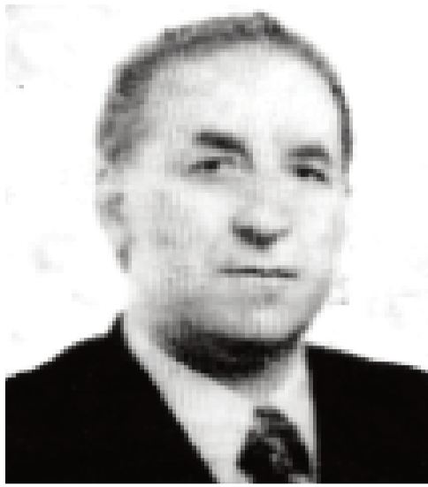
დასაწყისი "ილორი" №171-241