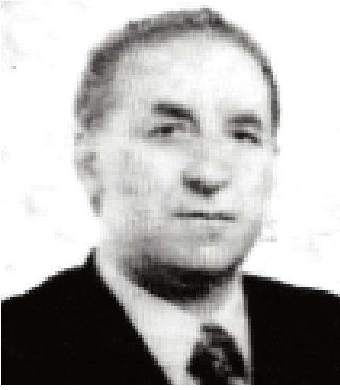
დასაწყისი "ილორი" №171-248

ახსენებენ რა მგერულის ლექსიკას, ავტორები წერენ, რომ მგერული ენის ლექსიკის გამოწვევით შესწავლის საფუძველზე ასაბუთებენ, რომ ამ ენის ლექსიკის აბსოლუტურად უდიდესი ნაწილი (98%) ხმამაძვირ საფუძველზეა წარმოშობილი და რომ ამ ენაში დღემდე შემორჩენილია პირველყოფილი მეტყველების დიდმნიშვნელოვანი კვალი. ეს მაშინ, როდესაც ენათმეცნიერებაში გაბატონებული მოსაზრებით თანამედროვე ენაში ასეთი კვალიც არ არსებობს და ენის წარმოშობის საკითხზე მსჯელობა წყლის ნაყვას, „მას ჩვენ ვერასოდეს გავიგებთ“ – ასეთ პირობებში აღნიშნული ავტორები ადასტურებენ, რომ მგერული ახასიათებს მსოფლიოს ოთხივე ტომოლოგის ენათა ნიშანთვისებები; რომ ეს ენა ავლუტინაციურთან ერთად ძირისეული ენაცაა, ფლექსიური ენაც და ინკორპორაციული ენაც (ცხადია, ავლუტინაციურის დომინანტობით). მგერულის მონაცემების გამოკვლევას და ამ მონაცემების სხვა ენების მონაცემებთან შედარებით ანალიზით ისინი ასაბუთებენ, რომ ენის წარმოშობის საფუძველს წარმოადგენს სავანთა ბუნებობა, კერძოდ, ხმამაძვირობა. მიუკერძოებელი სპეციალისტები ამ ნაშრომებს მაღალ შეფასებას აძლევენ.