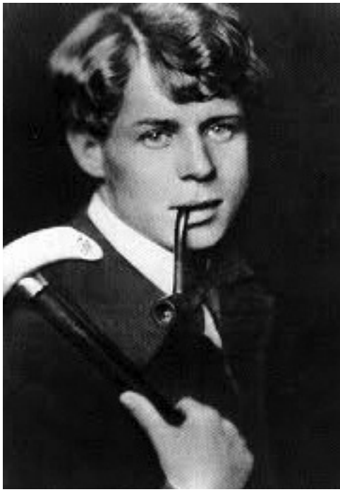
ბრძოლაში მამიდები ჩაბნენ

„სტუმრები, სტუმრები, სტუმრები... ნეტავ ვინმე მისხნიდეს მათგან. და, რაც მთავარია, მუშაობაში ხელს მიშლიან“, - წუხდა ესენინი. არადა, მუშაობა სურდა. დასასრულელებელი იყო „სპარსული მოტივები“, დროისა და განწყობის დაკარგვა არ შეიძლებოდა.