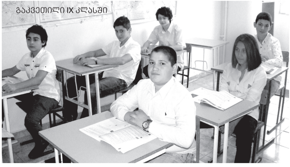
ბაკვეთილი IX კლასში