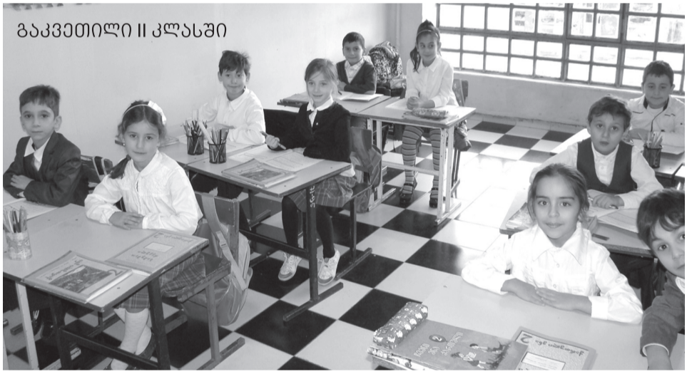
ბაკვეთილი II კლასში

მოკლე თეზისები: -შესავალი- ძირითადი ზნეობრივი ფასეულობები: ➤ პიროვნების თავისუფლება; ➤ სამართლიანობა; ➤ ადამიანის სიცოცხლე; ➤ მშვიდობა; ➤ ოჯახური ტრადიციები; ➤ სიყვარული და ერთგულება; ➤ პატრიოტიზმი;