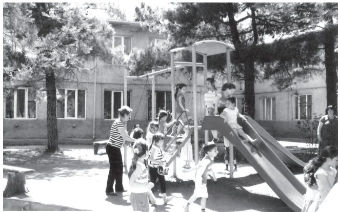
ასეთია ჩვენი ეზო