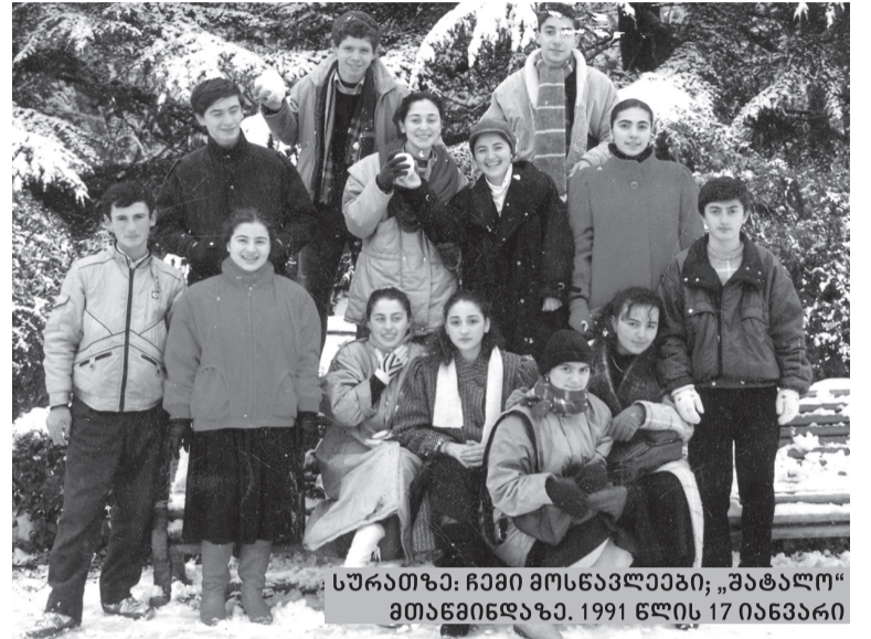
სურათი: ჩემი მოსწავლეები; „შატალო“ მთაწმინდაზე. 1991 წლის 17 იანვარი