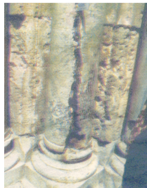
სურათზე: გვერდებამურული ბაზეთშილი მარმარილოს სვეტი, რომელზეც შემეღესი ქართული წარწერაა გამოსახული, ღვთისმად დასაშკარა ნიშნად ღვთის ძალისა.

ყველას უხაროდა. მართლმადიდებელი არაბები სიხარულით ხტოდნენ და ყვიროდნენ: “შენ მხოლოდ ხარ ღმერთი ჩვენი, იესო ქრისტე! მხოლოდ ჩვენი რწმენა, მართლმადიდებელ ქრისტიანთა რწმენაა ჭეშმარიტი!” . ისინი მთელ იერუსალიმში