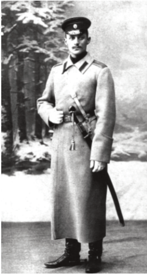
აპაკის გარდაცვალების გამო