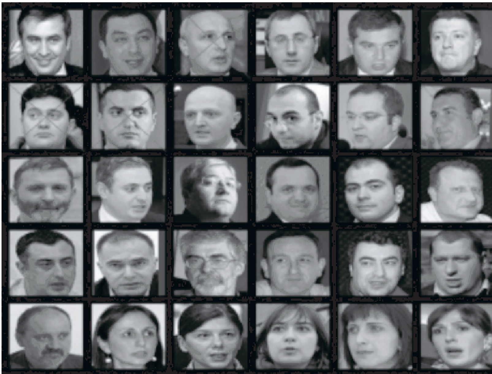
იცნობდეთ, ესენი საქართველოს ეკლესიის დაუპინძელი მტრები არიან. არასოდეს ჩამოართვათ მათ ხელი!