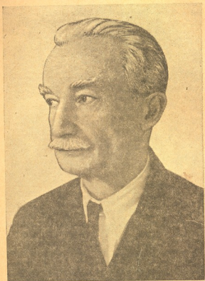
აკადემიკოსი ივანე ჯავახიშვილი