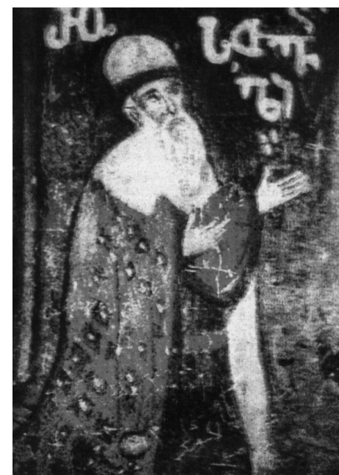
ვინა თქვა ძლევა ჩვენი ვეფხისტყაოსნიანი მამებისა?