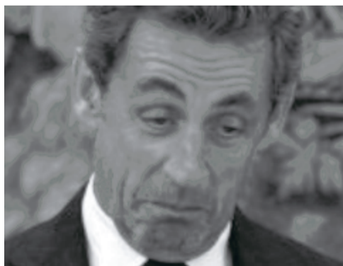
თუ მსურს იყო დღემდე, დღეში სამჯერ მაინც მოკვდი სიცილით!

“მონ ამიზ, ჩემო ლამაზებო, კობტებო და კულრაჭებო. მომენტრეთ. აგერ უკვე ორი წელია, პრეზიდენტი აღარ ვარ, მაგრამ თქვენი ხატება ჩემშია და სულ თავს მახსენებს. როგორც მერაბ სეფაშვილი იტყოდა – “თქვენი მე, ხატება, დამდევს თან, ყოველდღე, ყოველწუთს, ყოველწამს”.