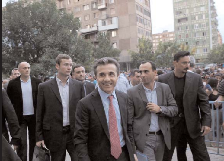
მოგესალმებით რუსთაველებო! მივესალმები მთელ საქართველოს!

ფერისცვალებას გილოცავთ, ხალხო! რუსთავს, ისე, როგორც მთელ ჩვენს ქვეყანას, დიდი ისტორია აქვს, მაგრამ მე-20 საუკუნის შუა წლებიდან რუსთავმა ახალი სიცოცხლე შეიძინა და საქართველოს უდიდესი სამრეწველო ცენტრი გახდა.