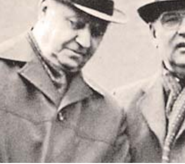
რამ ჩემს ცხოვრებაში... იმ დროისათვის სხვა ქვეყნებში ნამყოფი ვიყავი, ოღონდ ბევრგან არა, - ცხრა ქვეყანაში. ჩემთან, თბილისშიც, ბევრჯერ მიმდია უცხოური დელეგაციები, ზოგჯერ საკმაოდ მაღალი დონისაც, მაგრამ ისინი მაინც მხოლოდ სტუმრები იყვნენ. დიპლომატობას რაც შეეხება, ის მხოლოდ ჩემს ენამოსწრებულ, გამჭრიახ თანამემამულეებთან, და კიდევ მოსკოველ იერარქებთან ურთიერთობისას თუ დამჭირებია, როცა მათგან რაღაცა გამოველოდი. უცხო ენების არცოდნა, მხოლოდ მშობლიური ქართული და რუსული, თანაც უსამუშაო აქცენტით, გამოციდილებებისა და სპეციალური ცოდნის უქონლობა... კარგი ერთი, ნეტა ხომ არ მომეყურა?

„მინდა განვავადო ჩვენი საუბარი. საბოლოო გადაწყვეტილება მივიღეთ: საგარეო საქმეთა მინისტრის თანამდებობას ვთავაზობთ. ხვალ დილით მოსკოვში გვით (სულ რაღაც ორ კვირაში გორბაჩოვმა, როგორც ჩანს, ევროამერიკაში საქმე ჩააწყო და შეგარდნაზე საბჭოთა კავშირის საგარეო საქმეთა მინისტრად გააშწესა! – ჯ.დ.)