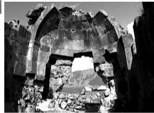
ვერანას სამსარი გარედან და შიგნიდან

მენტი, რომელზეც რამდენიმე ქართული ასომთავრული გრაფიკაა შერჩენილი. საძირკვლის მოხაზულობის თანახმად, ეკლესიას სამხრეთისა და ჩრდილოეთის მინამუხეები ჰქონია და ნაგები ყოფილა სუფთად გათლილი ქვის თანაბარი კვადრებით. შთამბეჭდავია მონასტრის გალაგვის ის მონაკვეთი, რომელშიც არქიტრავეებით გადახურული ღრმა კარიბჭეა ჩართული. ამ ეკლესიის ზევით, სამანქანო გზასთან გაცილებით ახლოს, სომხებს სულ ახლახან პატარა სამლოცველო აუგიათ.