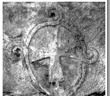
ღრტილას ტაძარი 1308 წლის წარწერით. ცილინდრული ფორმის არშიით და ორიგინალური ჯვრით

ში ბურუნდებით, იქიდან კი დილაადრიან გაცილებით უკეთეს მარშრუტს ვირჩევთ მელვრეკის გავლით.