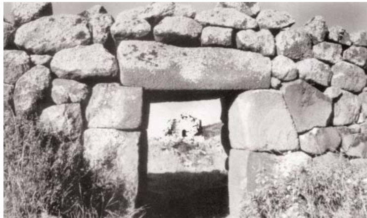
მელვრეკის ნამონასტრალის კარიბჭე გალაგანში