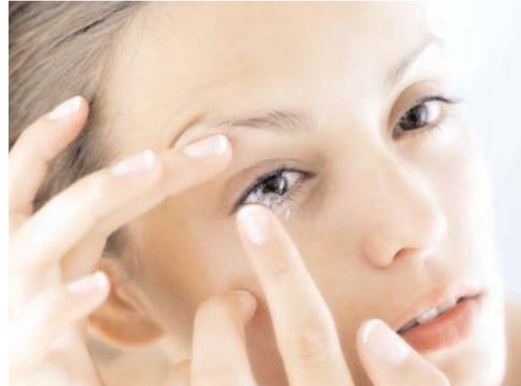
ნუ შეშინდებით – თუ ღინზები სწორად არის შერჩეული, ეს სიმპტომები რამდენიმე დღის შემდეგ გაივლის; * ღინზები ინახება მხოლოდ და მხოლოდ სპეციალურ სტერილურ ხსნარში, რომელიც ყოველდღე უნდა გამოცვალოთ. თუ რაიმე მიზეზით ღინზა ვერ მოათავსეთ ხსნარში კონტეინერში და ის ძლიერ გამოშრა, მათ ხელახლა ვერასდობით ვეღარ დასველებთ, ამიტომ ისინი უნდა გამოცვალოთ; * ნურასოდეს მოისინჯავთ ან ატარებთ სხვის ღინზებს;

საქმე ის გახლავთ, რომ დაშვებული ქუთუთო აწევა ღინზას, ის, თავის მხრივ, კლერაზე ახდენს ზეწოლას და ირღვევა თვალის კვება და ინერვაცია. ასეთ დროს ადამიანს დილაობთ საზე ოდნავ შეშუპებული აქვს და სილურჯეც დაჰკრავს; * თუ ღინზებს მუქ წერტილებს შეამჩნევთ, გვერწმუნეთ, მათ აღარაფერი უშველის, ისინი აუცილებლად უნდა შეცვალოთ; * სასტიკად აკრძალულია ვადაგასული ღინზების ტარება, რადგან ისინი თვალის რქოვანას გარსის ანთებას – კერატიტს იწვევს. * კონტაქტური ღინზები რაც შეიძლება მოკლევადიანი უნდა იყოს, არა უმეტეს სამთვიანისა. მართალია, ასეთები ცოტა ძვირია, მაგრამ რქოვანას ჯანმრთელობისთვის აუცილებელია. * ნახევარ წელიწადში ერთხელ ადამიანი ქუთუთოების ჰიგიენური დამუშავებისთვის უნდა ეწვიოს ექიმს კონტაქტური ღინზების კაბინეტში. გარდა ამისა, ეს ვიზიტი კიდევ ერთხელ მოჰფენს ნათელს იმას, თუ რამდენად სწორად შერჩეული ღინზაა, რადგან თუ ყველა პირობა დაცულია, ღინზები პრაქტიკულად უვნებელი ხდება. * ბოლო დროს ასე მოღური ფერადი ღინზების საწინააღმდეგო ექიმებს არაფერი აქვთ, მაგრამ მნიშვნელოვანია გვანსოვდეს, რომ არსებობს ყალბი ღინზებიც, რომლებიც არ შეესაბამება სამედიცინო სტანდარტებს. ამიტომ ერიდეთ ღინზების შექმნას კერძო პირებთან ან საეჭვო დაწესებულებებში. გვერდი მოაზნადა ზვიად ღონღაძე