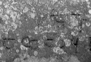
კარნეთის ტაძრის ინტერიერის ერთი კუთხე, დამსობილი ბალაგზრის გასუფთავება და იოანე ოქროპირის წარწერის ნაწილი