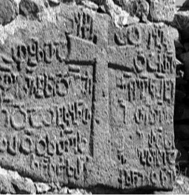
დულაღისის ტაძარი გარეთ გამოტანილი ტრაპეზის ქვით და რელიეფური წარწერა

როცა გამაჰმადიანებული ქართველობა — იერლი თურქეთში გადაიხვეწა, მისი ადგილი წალკის რაიონიდან გადმოსული სომხების ახალმა გვგუფმა დაიკავა.