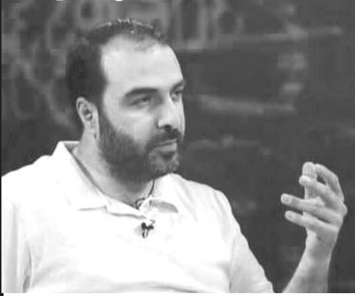
dasarul i. dasawysi ix. saerTo gazeTi- #02 (236)

— ახლა 9 წლიანი რეჟიმის მთელი სისასტიკე დახატეთ. მაშინ, მით უმეტეს გაუგებარია, თუ ვიცით, რომ ასეთი რეჟიმი იყო, ახალი ხელისუფლება ხალხის წინააღმდეგ რატომ მიდის? ქართველ ხალხს საკონსტიტუციო ცვლილებები კი არა მკვლელი რეჟიმის „ფუძის“ ხელისუფლებიდან ჩამოშორება უნდა. ხალხს უნდა უსმინონ თუ მაკვირინს?