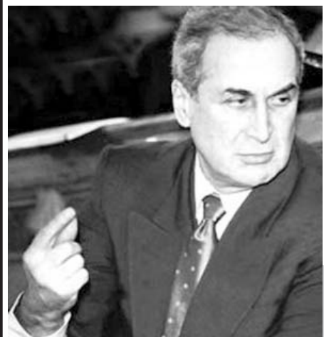
ქმედებებზე რომ არ წასულიყო, ცნობილ კატაკლიზმებს ადვილად გადავიტანდით, რომლის შედეგადაც ყველაზე მეტად ჩვენი ქვეყანა დაზარალდა.

სრული დამოუკიდებლობა, მხოლოდ სოციალისტური ბანაკის ქვეყნებს (აღმოსავლეთ ევროპა) და სავარაუდოდ ბალტიისპირეთის რესპუბლიკებს უნდა მიეღოთ. დანარჩენი საბჭოთა რესპუბლიკები კი ისეთივე დამოუკიდებლობას მიიღებდნენ, რაც მანამდე ხსენებული სოციალისტური ბანაკის ქვეყნებს ჰქონდათ, ანუ საგარეო პოლიტიკაში რუსეთს დაუჭერდნენ მხარს, საშინაო პოლიტიკას კი დამოუკიდებლად აწარმოებდნენ. ამას აშშ-იც ეთანხმებოდა და საერთოდაც ეს საბჭოთა კავშირ-ამერიკის ერთობლივი გეგმა იყო. საქართველო მაშინ რადიკალურ