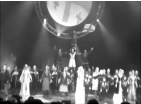
ში დაღუპული ბიჭების საფლავებზე ცეკვის ტოლფასია“. როგორია თქვენი პოზიცია ან სამზღლის მიერ მოსკოვში გამართულ კონცერტთან დაკავშირებით?

— რატომ, რა არის მიზეზი? — დასავლეთს აქვს დიდი ეკონომიკური პოტენციალი. საქართველოს რაც შეეხება, ჩვენთვის დასავლეთი მიზიდივლია იმიტომ, რომ იქ თავმოყრილია ყველა ღირებულება, რაც ქართული კულტურისთვისაა დამახასიათებელი. ამდენად, საუბარი იმაზე, ივლის თუ არა საქართველო დასავლეთისკენ, დიმილის მომგვრელია, აბა, სად, რა გზით უნდა წავიდეს?