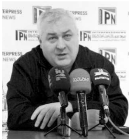
ავანთან, ცხადია, რომ ყველაფერი