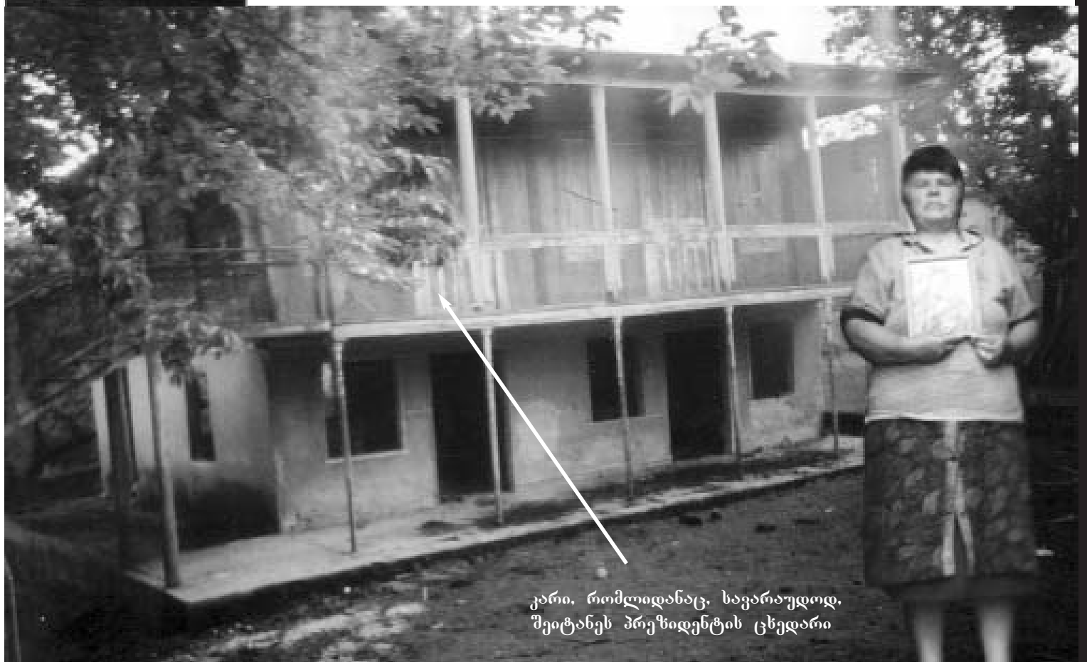
კარი, რომლიდანაც, საგარეუდოდ, შეიტანეს პრეზიდენტის ცხედარი

P.S. 31 მარტი ზვიად გამსახურდიას დაბადების დღეა. რომ არა საქართველოს მტრების მიერ დაგვიპილი მუნანათური ტრაგედია, ზვიად გამსახურდიას 2013 წლის 31 მარტს 74 წელი უმუსრულდებოდა.