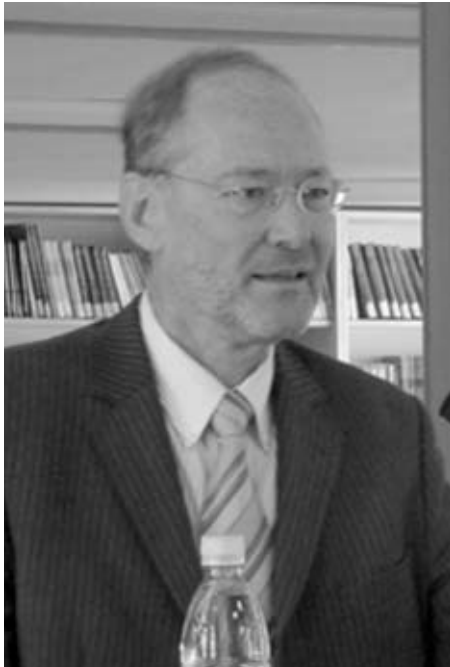
თბილისი, 2013 წლის 15 მარტი