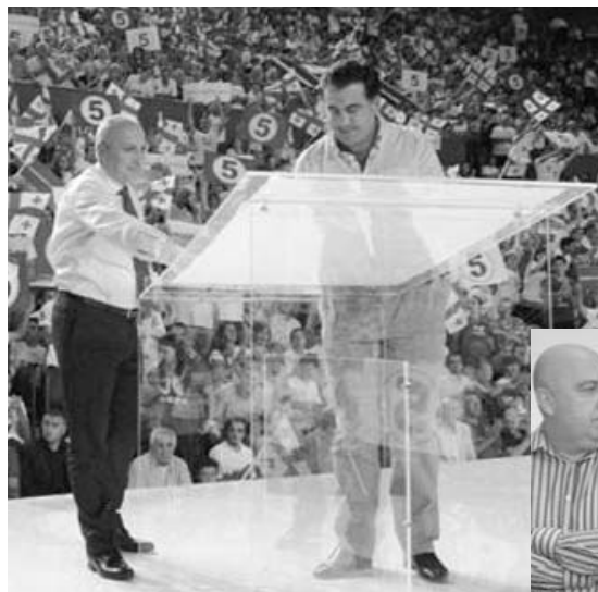
19 აპრილს, რუსთაველის პროსპექტზე, პარლამენტის ძველი შენობის წინ „ნაციონალური“ საკმაოდ მრავალრიცხოვან მიტინგს გვემავს.

მათ იმედი აქვთ, რომ მიტინგზე 9-10 ათასი ადამიანი მანაც მოვა, ეს კი სრულიად საკმარისი რაოდენობაა იმისთვის, რომ განხორციელდეს ის სცენარი, რომელიც კარგა ხანია „ნაციონალური“ „საიდუმლო“ ლაბორატორიაში მუშავდება.