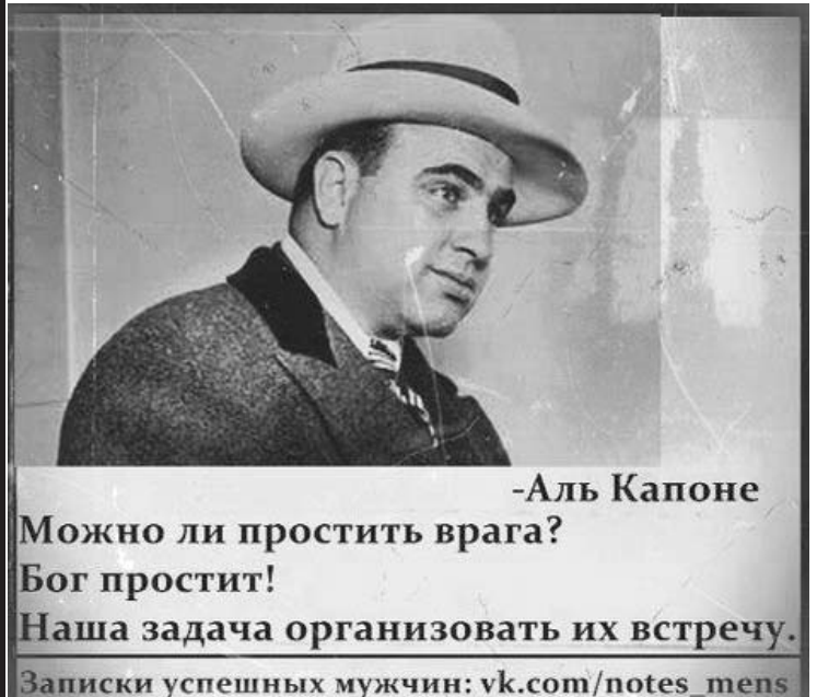
-Аль Капоне Можно ли простить врага? Бог простит! Наша задача организовать их встречу. Записки успешных мужчин: vk.com/notes_mens

„მიშა გომიაშვილი, რეზო ამაშუკელი, გიორგი გაბედავა და ლადო სადღობელაშვილი არიან პიდარასტები, ანუ ადამიანები, რომლებიც სიბოროტის ქმნას ეწადიან...“ — ირაკლი ვაჭარაძე