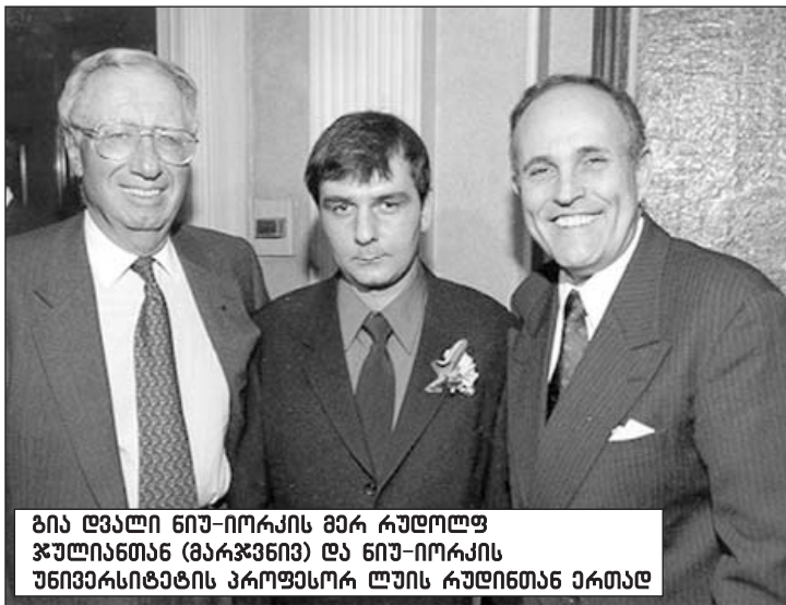
გიგა ლვალის ნიუ-იორკის მერი რუდოლფ ჰულიანთან (მარჯვნივ) და ნიუ-იორკის უნივერსიტეტის პროფესორ ლუის რუდოლფთან ერთად

გია დვალის, CERN-ის მუდმივი წევრი: „ეს პროექტი საშუალებას მოგვცემს ჩავიხედოთ დროის იმ მონაკვეთში, როცა სამყარო დიდი აფეთქებიდან ჯერ კიდევ წამის მეათედი ასაკისა იყო. ნულოვანი ექსპერიმენტი არის კაცობრიობის ყველაზე დიდი მიკროსკოპი, სამყაროს შესახებ მეცნიერული და ბიბლიური