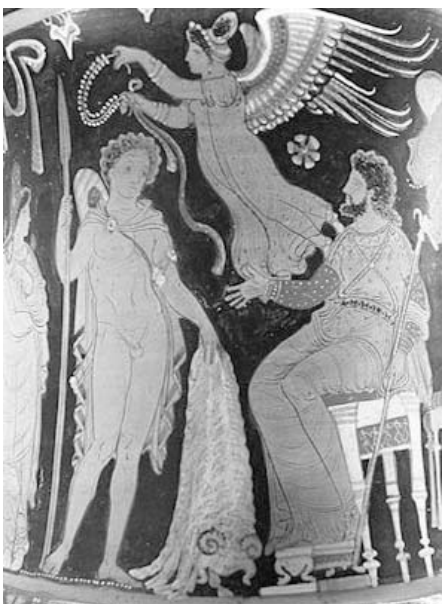
ნახონი ოქროს საწმისით ბრუნდება. აპელიური (თინის შურჭლის მხატვრობა. ძვ.წ. 340-330)

ჭეშმარიტებასთან ძალზე ახლოს მდგომი ვარაუდის დონე შეიძლება ეწოდოს იმ მდგომარეობას, რაც „ეფუთის“ და „ანანუკთან“ დაკავშირე-