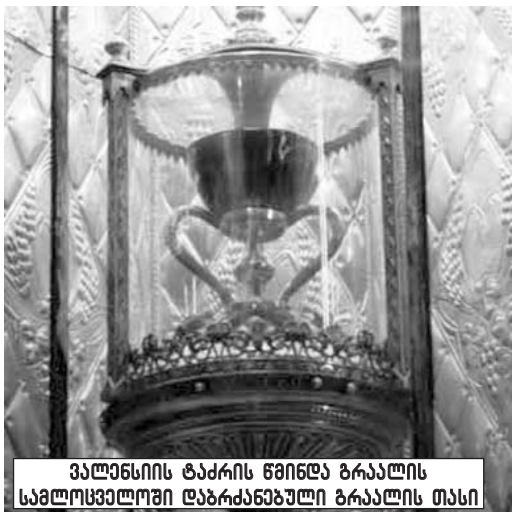
პალესტინის ტაძრის წინააღმდეგ ბრაალის სამლოცველო დაზარალებული ბრაალის თასი

„ბრაალინი“ მატერიალური გამოვლინებაა ალისა, რომელიც სამყაროს გულშია, ასევე ადამიანისა და დედამიწის გულში. ზეიად გამსახურდა დირ „გრ-ს“ იბერული კულტისთვის დამახასიათებელ მხარეებს. „გრ“ ძირია სიტყვისა „ვიგრ“, რაც ნიშნავს ნიშნავს. ნიანგი მაიასასა და ეგვიპტელების მიხედვით თავდაპირველი სულის, ყოვლის შემქმნელი, ანუ