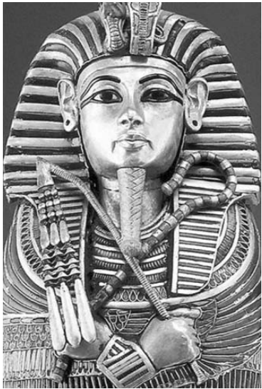
ბაბრქაიბა. დასაწყისი იხ. „საერთო განცხადება“ №8-15