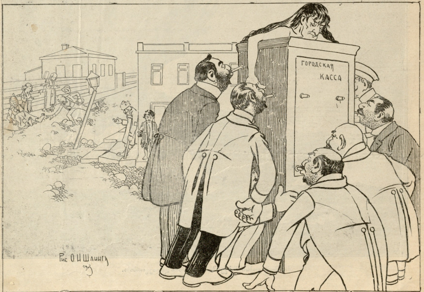
სწავალი ტვეღისის ქაქაქეს კასსა: სწოგენ და სწოგენს...

მეორფსია მეკურება. გამიწინელი სწრა-ბერწინარი შუელკა თავის მიგონებათა წრას. მიგონებანი ერთად გამთვ ფწანგულს, გწრმწულს და იხელადრის ეწმწე. შესლცა ეკწინსკუორეული აწწინავთას მეკურების გამოსცემად. არტსტოქაქელი ჭინორწრად მთადებს 800 ათას ფწანეს. მიგონებანი დსკრთიებული იწუნება, დამბეჭდვას სკეკეთესო (აბწინერ) ქაქაქედსუე და ეკწინმდიათი უღიბება 200 ფწანკად.