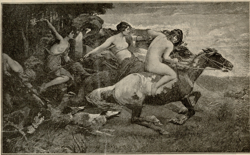
ამირაძეკა. — სურათი აღტოპელებისა