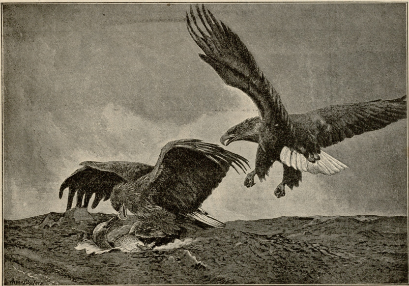
ქალმაძრეკობას მსხვერძლა.