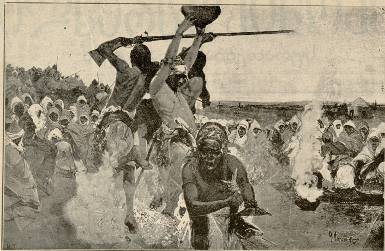
არაბთა პანაკეა.—სურათი ვომბას.