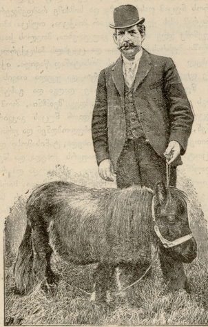
რუბარესი ცხენი ქვეყანაზე.

— ბოთლისა შვიან რაკა სდვას, იგივე წარმოსდინდნისა. სლომე და მზარეული გულიანად იციროდნენ, პავლე ძალდატანებით ილიმებდა, ნუცა კი სდუმდა. — რასაცა დალევ შენია, რაკ არა დაკარგულია. დალიე იზერელო! და სასეე ჰიქა მზარეულს გადაუდგა. — აბა, შენ რავე შეგედრები: სმაში განთქმული კაცი ხარ! — სჯობს სიხიზლესა წაზახსა, სიმთვრალე სახელოვანი. — იი, კარგი თუ ღმერთი გწამს-და! მადღერი სპა როგორ შეიძლება. — უსაყვედურო სალომემ. — ზოგჯერ სპა სჯობს არა სმასა, ზოგჯერ სითაიცა და- შედგის. — პასუხი მოუტრა აკოფამ და ცოტა ხნით დაიწყე- ბული ნუცა ხელმორედ მოაკონდა: — ქორწინებას ვერ ვინ შესცეს, არ საქმელი არ იქმნების.