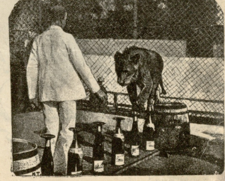
ბურღინის ზოთალოგურ მჯგმა ღვინის გაწრთება.

იქიდან მიწის სახლში მომუშავე ნუცას საღამომის პაე- ლეს ჩაქების მდღეებში რახა-რუხი და საბერგლის გრიალი ესა- მოდა. შუადღისას პავლე მიკლე ხნით შინ შემოიბრუნდა, ერთ ჯამს ლობიოს ან შორინის შექამანდს დასცლიდა და ისევე სამკედლოში მიზრბდა ხოლმე. ნუცაც მალე შეეჩვია თავის მოვალეობას. ქმარს სადღის უშუაბედმა, საღამოზე სადღის